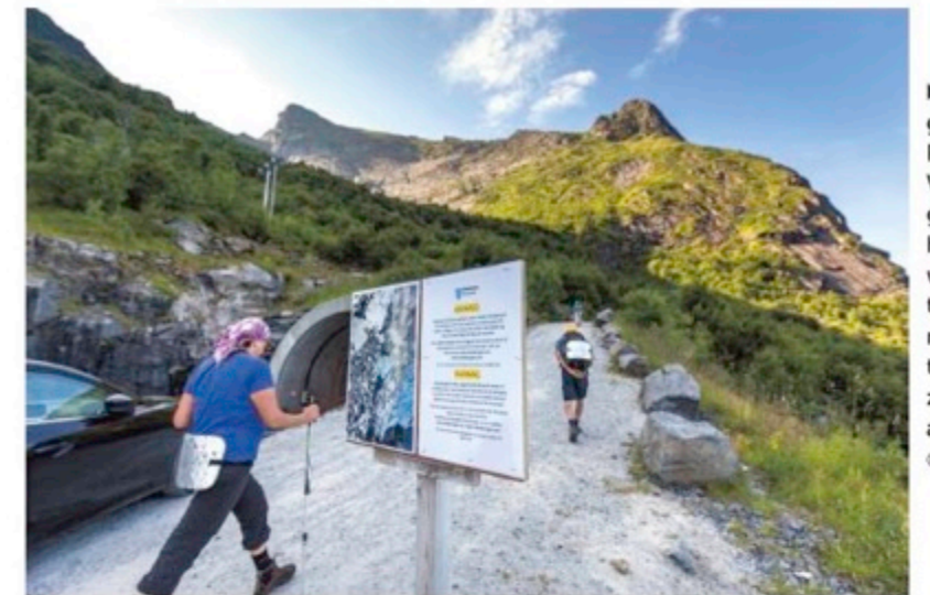
Wandelaars gaan richting Reinebringen. Volgens de gemeente is het onverantwoord de berg te beklimmen, maar daar trekt niemand zich wat van aan.

Nog een paar weken en de zomerse hectic is voorbij. Tijd en rust voor de betrokkenen om na te denken hoe het de komende decennia voor iedereen leuk blijft op de eilanden.