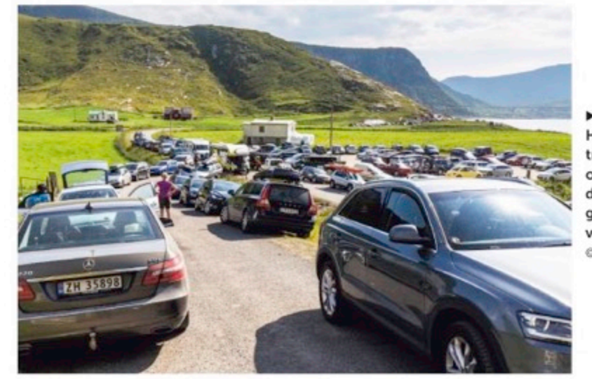
De weg naar Hauklandstrand staat op sommige dagen over de gehele lengte volgeparkeerd.