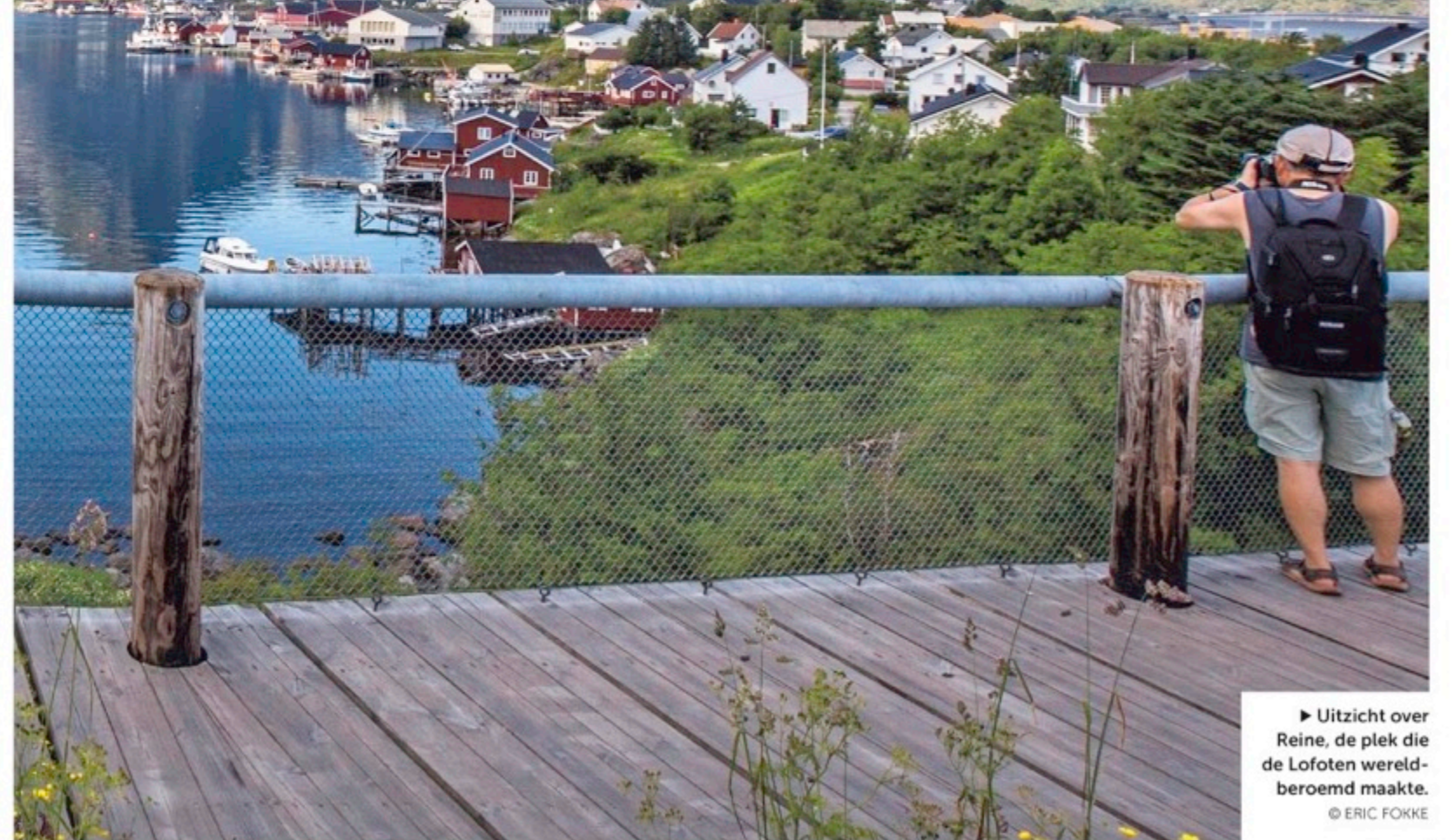
Uitzicht over Reine, de plek die de Lofoten wereldberoemd maakte.

Ondanks borden die melden dat dit drinkwater is en kamperen niet is toegestaan, werden deze zomer zes tenten ontdekt en lag het wc-papier op de oevers. Nu is de hele heuvel waarachter het meer ligt volgestouwd met borden 'No camping' en is over de hele lengte van de heuvelrug een rood-wit lint gespannen.