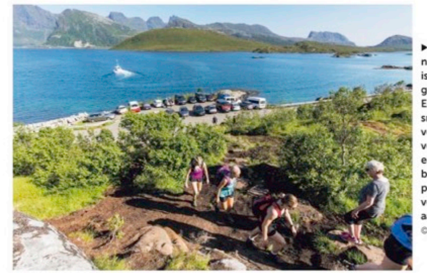
De wandeling naar Kvalvika is populair geworden. Een leuk smal padje veranderde vorig jaar in een vele meters breed modderpad. Nu wordt verhanding aangebracht.