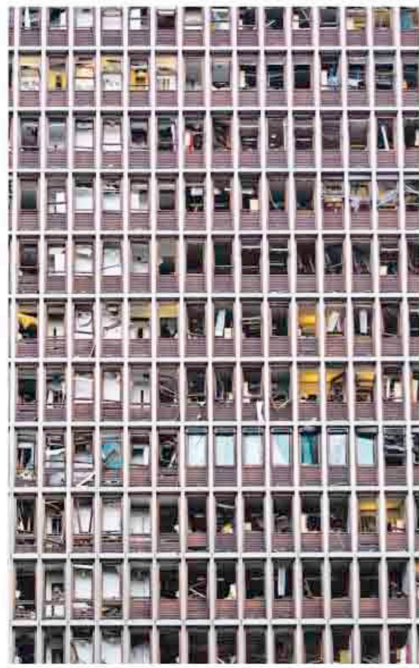
Regeringsgebouw na de aanslag.