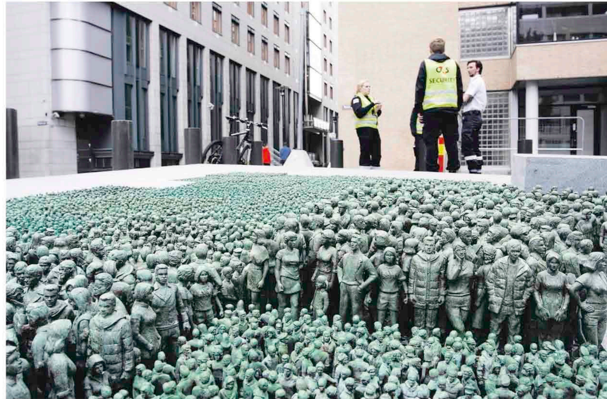
Duizenden bronzen mensfiguren verbeelden in het regeringskwartier van Oslo de saamhorigheid die er is sinds de aanslagen door Breivik.